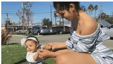
How To Get Rich