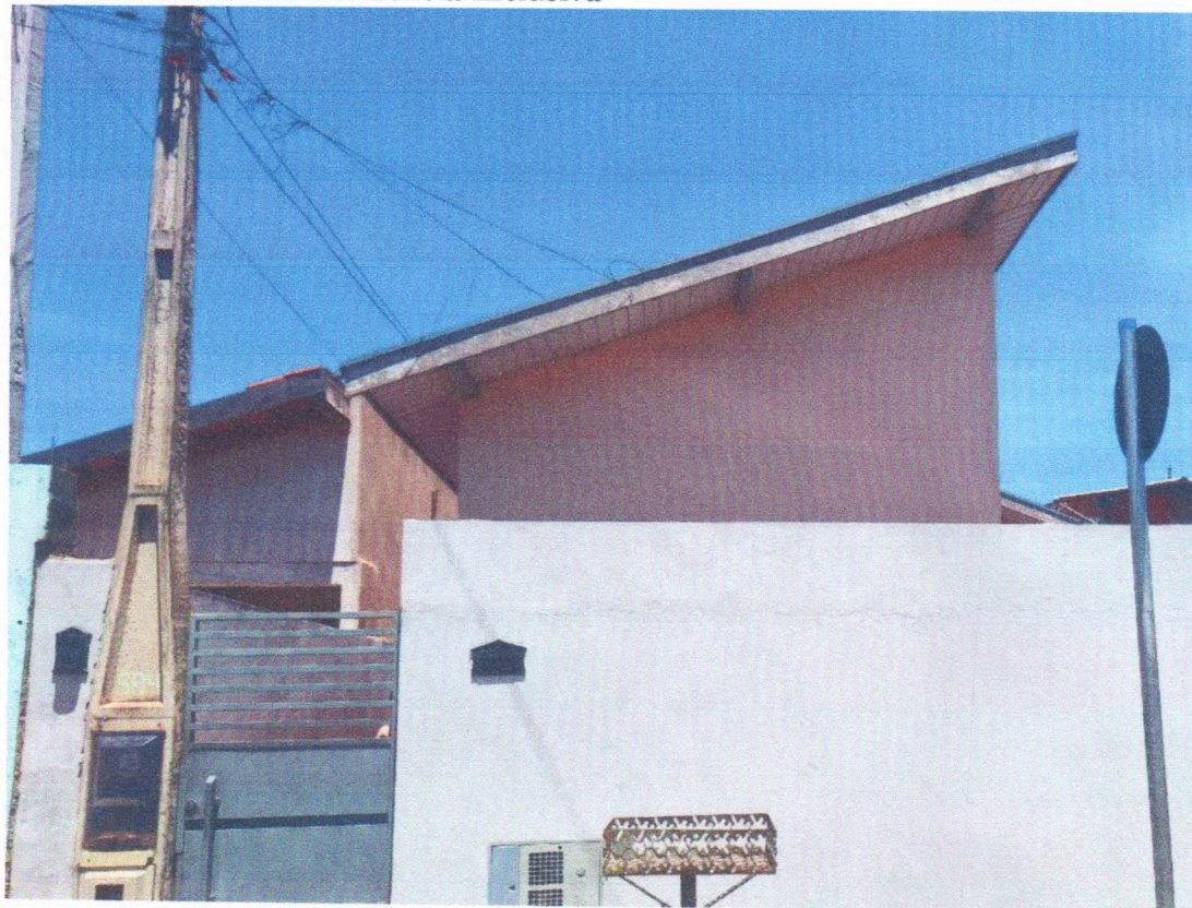
Foto da Fachada da Residência Inclusiva