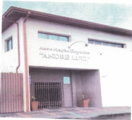
Foto da Fachada da Sede: