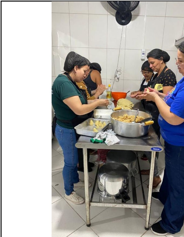
Grupo Mulheres em Ação – Destinado as responsáveis pela PCD

SERVIÇO TIPIFICADO: Serviço de Proteção Social Especial de Média Complexidade para Pessoas com Deficiências e suas Famílias, ofertado em Centro Dia PCD.