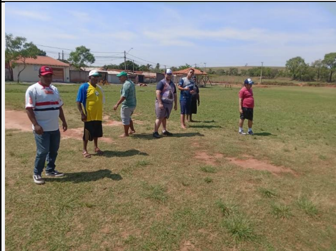
PARTICIPAÇÃO ATIVIDADES EXTERNAS