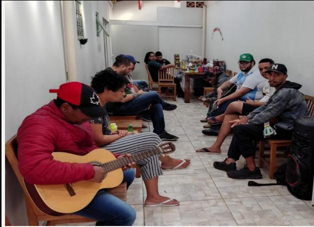
Oficina de Musica

ASSOCIAÇÃO DO CORAÇÃO MISERICORDIOSO DE JESUS – ACOMJE Rua: Ida Vidalli Mazoni 674 Parque Pampulha CNPJ: 08.965.301/0001-61 Utilidade Pública: 4.487 de 19/10/11 CMAS nº18/2008