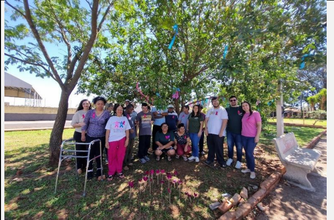
PARTICIPAÇÃO ATIVIDADES EXTERNAS – Campanha Outubro Rosa e Novembro Azul