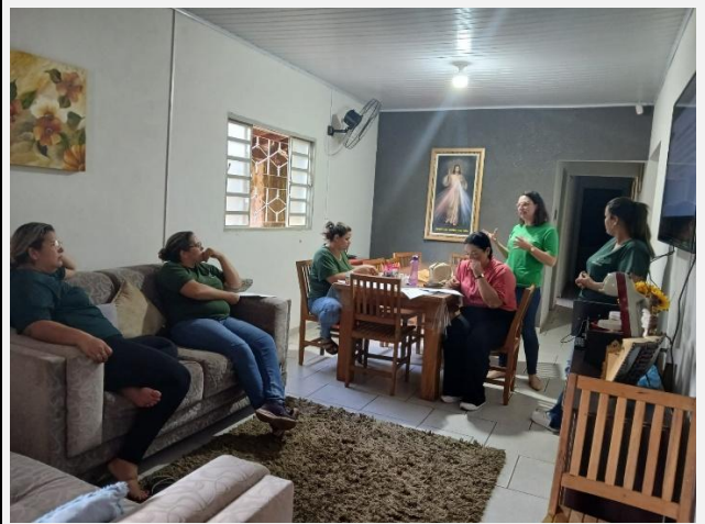
Reunião de Equipe