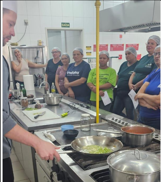
Capacitação Mesa Brasil