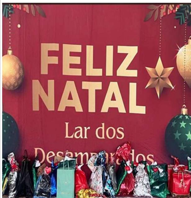
11 - Realizou-se a entrega de presentes natalinos a todos os idosos, como ação de valorização e acolhimento.