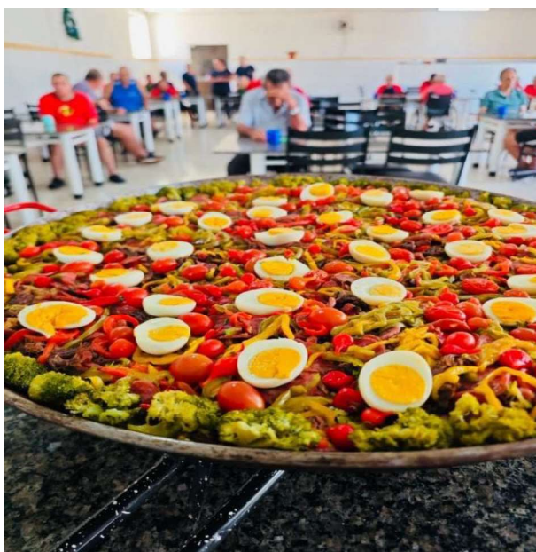
12 – Almoço de Natal