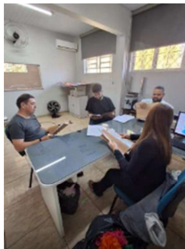
6 – Discussão de Casos