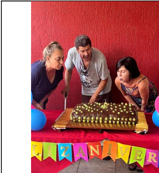
1 – Aniversariante do mês

OSC: Lar dos Desamparados SERVIÇO TIPIFICADO: Instituição de Longa Permanência