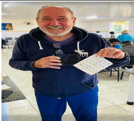
8 – Bingo do Dia dos Pais