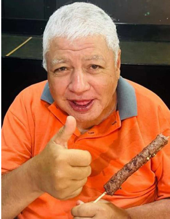
9 – Comemoração ao Dia da Pessoa Idosa , incluindo confraternização entre os idosos com churrasco.