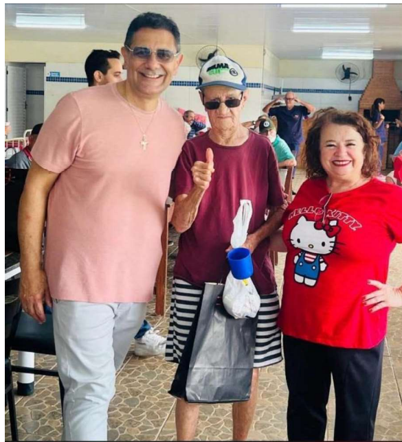
10 – Realização de confraternização natalina com os idosos, com participação dos colaboradores, visando à promoção da convivência social.”