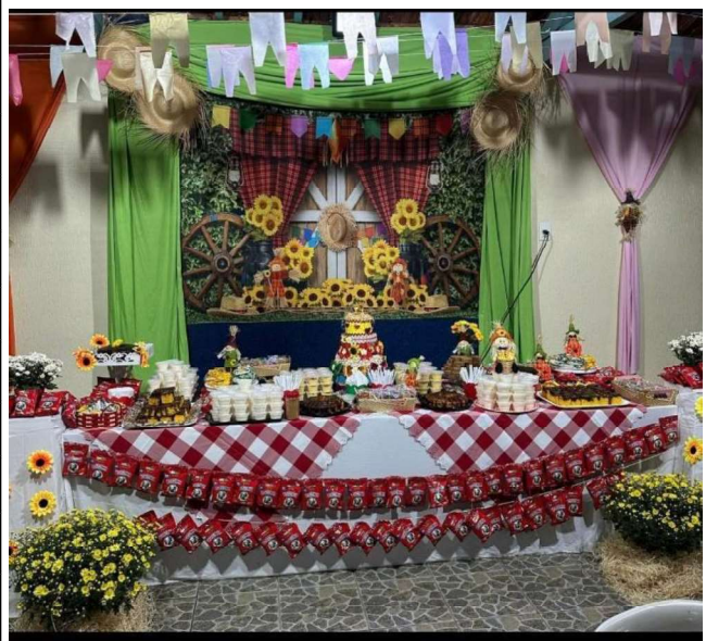
2 – Festa Junina