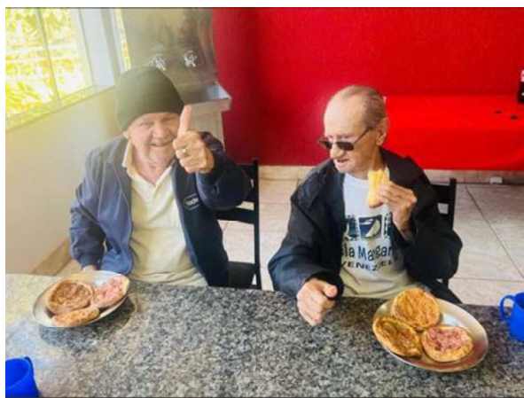
7 – Lanche especial do Dia dos Pais (sfhia do Rabbis )