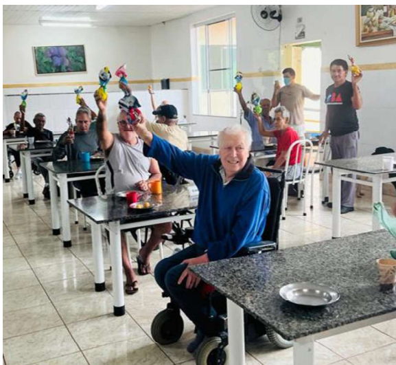
3 – Comemoração de Páscoa